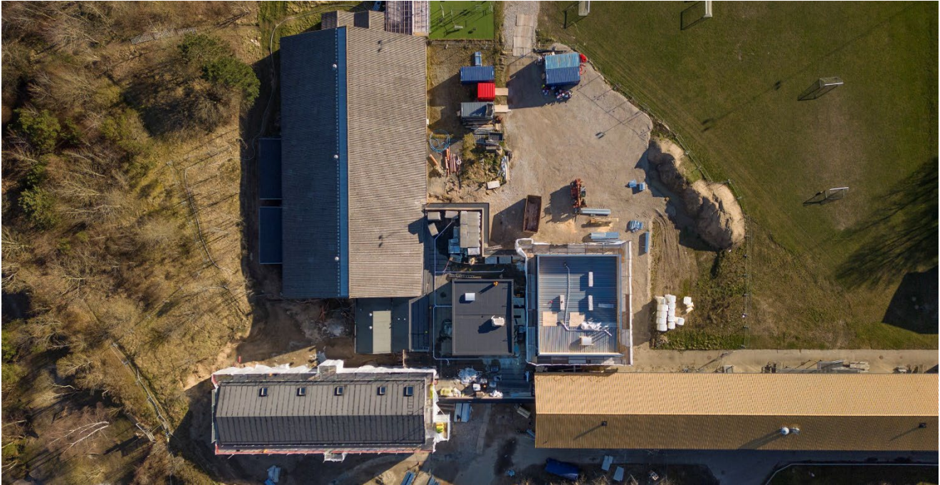
Molsværket set fra oven, april 2023

Hvad er Molsværket? Hvor ligger det? Hvem bygger? Og hvem skal bruge det? Få svar på nogle af dine spørgsmål herunder.