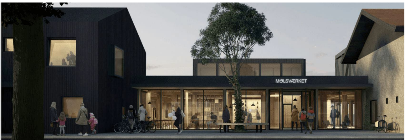
Molsværket set fra Lyngvej (illustration: Transform)

Molsværket er åbent for alle! Det bliver et sted, hvor skole, børnehave, vuggestue, dagpleje, idrætsforeningen, kirkerne – og ikke mindst de mange lokale foreninger kan finde plads til at være og lave aktiviteter. Og det bliver et hus, hvor man kan mødes og hygge sig – uanset om man er lokal og med sine unger til sport eller besøgende på vej ud i bjergene på sin cykel. Det bliver også et sted, hvor alle, der har lyst, kan hænge ud med venner over en kop kaffe eller en god bog. Med andre ord – et hus for alle.