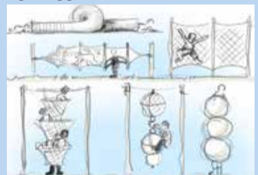
havneinspiration til legeredskaber