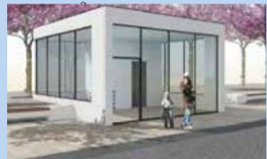
havnestue med gennemsyn