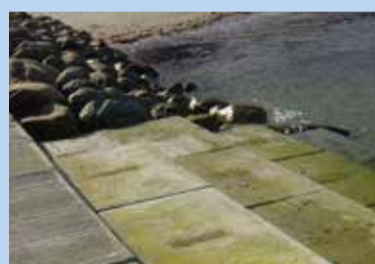
beton og sten