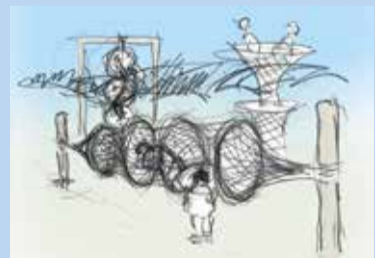
havneinspiration til legeredskaber