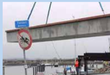
beton-flydebro hejses på plads