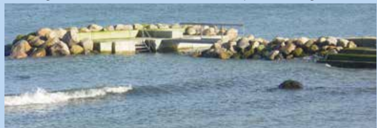
jern, beton og sten - tilpasning af aktivitets-ø til havnemiljø