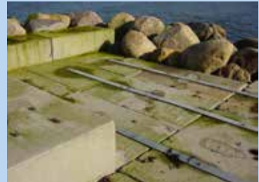
sten og beton